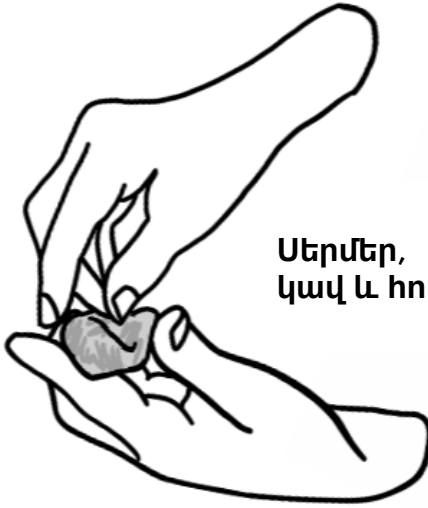
Սերմեր, կավ և հող