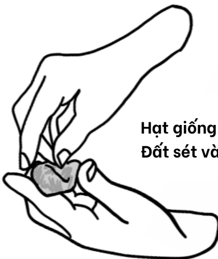
Hạt giống, Đất sét và Đất