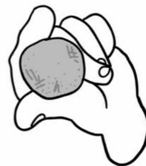
Bola de sementes