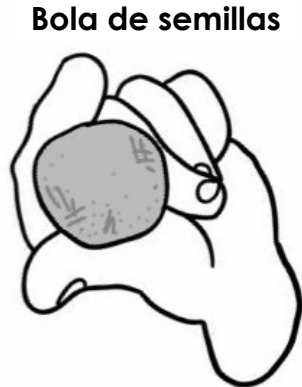
Bola de semillas