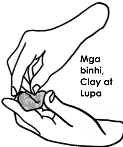
Mga binhi, Clay at Lupa