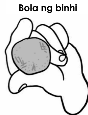
Bola ng binhi