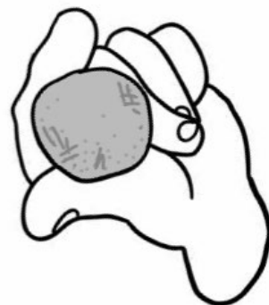
Bola ng binhi