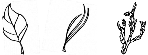
Malalapad Mala-karayom May kaliskis

6. Paano ginagamit ng mga hayop ang puno? Bilang pugad? Kinakain? Pahingahan? Anong uri ng katibayan ang nakikita mo?