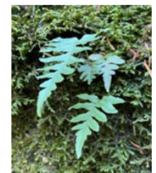
Lonchite enana Deer fern