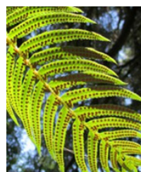
Helecho espada Swordfern