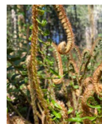
Brotes de helecho enana Fiddleheads