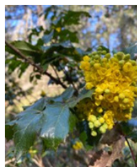
Uva de Oregon enana Dwarf Oregon grape